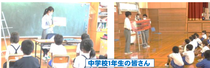
中学校1年生の皆さん

舟橋村が目指す教育は、段差のない教育です。小1プロブレムや中1ギャップ等の言葉はお聞きになったことがあると思います。舟っ子の健やかな成長を願い、こども園・小学校・中学校が連携して取り組んでいます。小中一貫教育の大きな柱は、小中学生の合同学習や教職員の連携研修等、例年は、様々な取組を行っていますが、本年度は新型コロナウイルス感染症の影響で削減、精選を行いました。12月3日(木)には、中学校2年生と小学校5年生が合同で学ぶ地域学校保健委員会が行われます。テーマは「立腰」(りつよう)姿勢についてです。また、その様子は第8号でお知らせしたいと思っております。少し前ですが、9月30日(水)には中学校1年生が本校で読み聞かせ活動をしてくれました。成長した中学生らしい姿を見ることができとても感動しました。そんな中学生の先輩たちの様子もきっと刺激になったのだと思います。11月13日(金)には3年生が1年生に体育館で読み聞かせ活動をしてくれました。中学生だけでなく、舟橋小学校では舟橋村立図書館の方々が読み聞かせをしてくださる機会もあります。「読書」というよき伝統がつけられつつあることを感じています。一村一小一中のよさを生かし、じっくりと子供たちのよさを伸ばす教育に努めていきます。