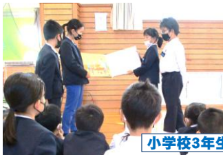
小学校3年生から1年生へ